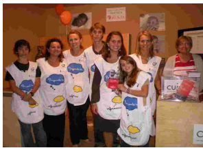
Voluntarios del HSJD en el Stand de Cuidam

El deporte y la solidaridad se unieron en el Concurso de Salto Internacional celebrado en el Club de Polo, el pasado 13 al 16 de septiembre para recaudar